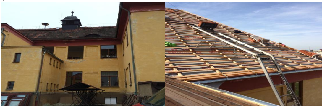
Výměna střešní krytiny